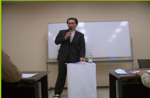
坂田院長講演会風景