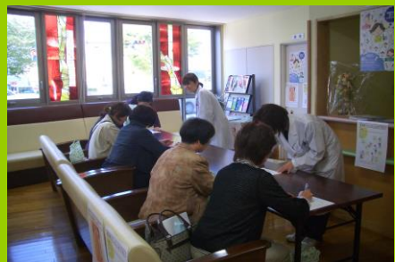
骨の健康度チェック