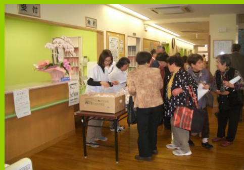
蒸しパンプレゼント