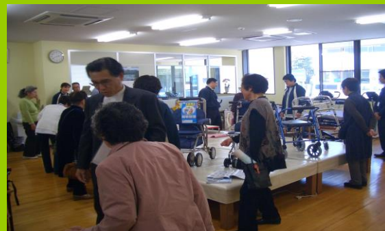
福祉健康機器展示会